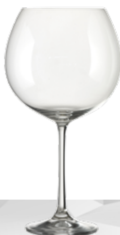
VINEAS 67 67 cl h 224 mm Ø 106 mm