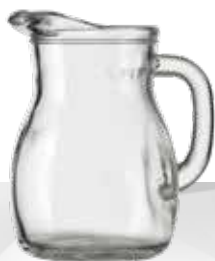
BODEGA 0.25 L