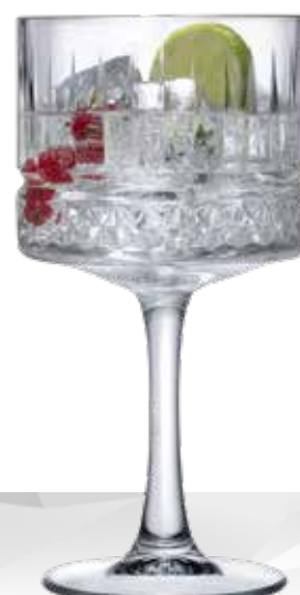
ELYSIA 55 GIN TONIC