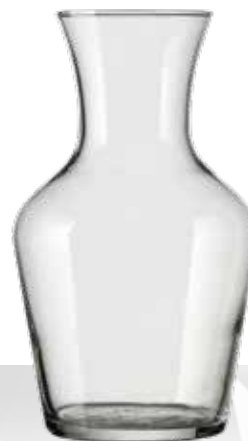
CARAFON 1 L