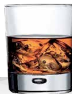
CENTRA 36 LD