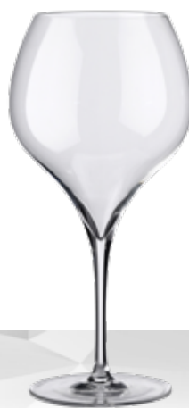
SUITE 73 BALLOON