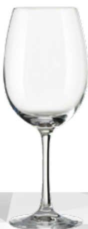
VINEAS 47 47 cl h 214 mm Ø 86 mm