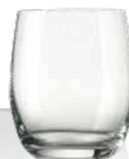
VINEAS 30 30 cl h 97 mm Ø 84 mm