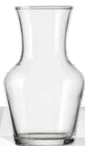
CARAFON 0.25 L