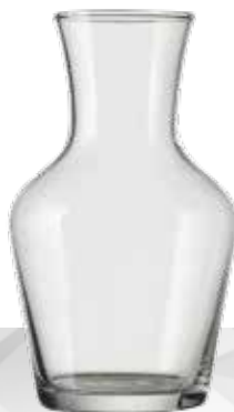
CARAFON 0.5 L