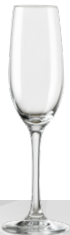
VINEAS FLÛTE 22 cl h 230 mm Ø 55.5 mm

Materiale pregiato privo di metalli pesanti Brillantezza, trasparenza e resistenza Taglio a freddo