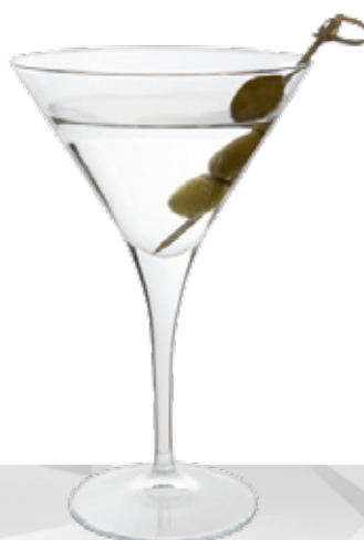
YPSILON COCKTAIL 24.5