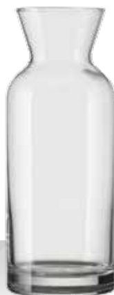
DIANA 0.5 L