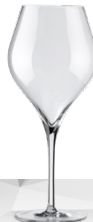
SUITE 54 UNIVERSALE