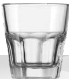
CASABLANCA 36 DOF*