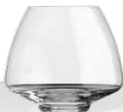
SKYLINE 45 TUMBLER