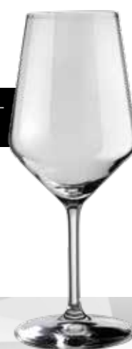
HORECA 53 HL