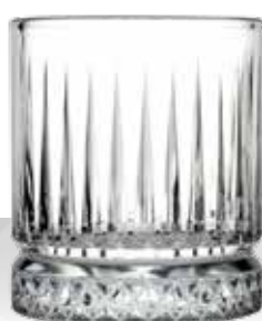
ELYSIA 21 WHISKEY