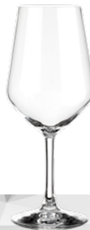
LOUNGE 53 HL 4.0