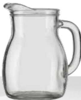
BODEGA 0.5 L