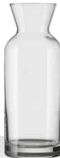
DIANA 1 L