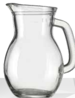
BODEGA 1 L