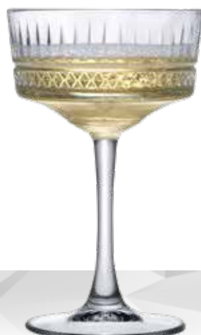
ELYSIA 26 CHAMPAGNE