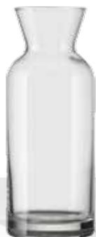
DIANA 0.25 L