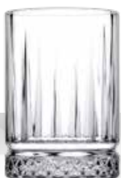
ELYSIA 6 SHOT