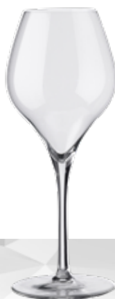
SUITE 38 FLÛTE