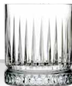
ELYSIA 36 DOF