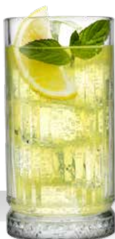
ELYSIA 45 LD