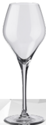
SUITE 27 FLÛTE